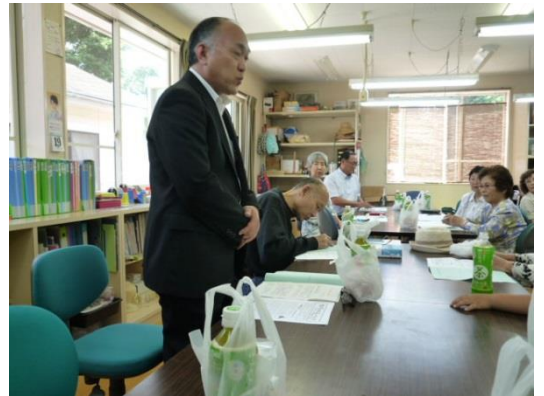
▲挨拶をする障害福祉課の名雪課長