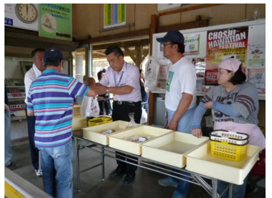
▲外川駅での販売の様子