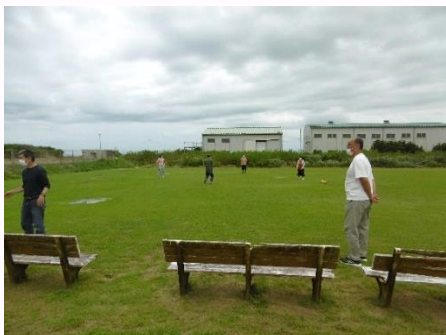
▲公園でのフリスビー