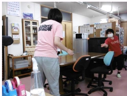
▲室内での卓球 Nさんのうまいラケットさばきに驚き（失礼）▲