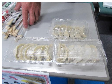
▲焼き餃子(生)も販売