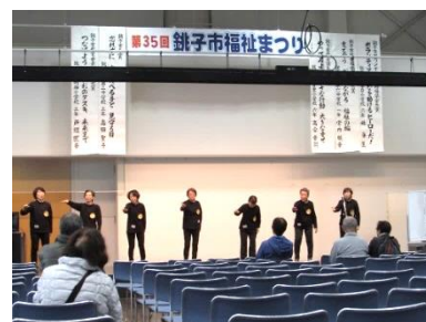
▲ホールでの手話コーラス

今回は、パン約450個、焼きそば100食、わらび餅200パックを用意して販売に臨みました。販売開始は午前10時10分でしたが、10時を過ぎると来場者がどんどん訪れ、パンや焼きそばを購入して行く状況となりました。以外にもわらび餅が人気で良く売れ、一番数多く用意したにも関わらず、最初に売り切れとなりました。その他のものも約2時間で完売しました。ご購入下さった皆さん、ありがとうございました。