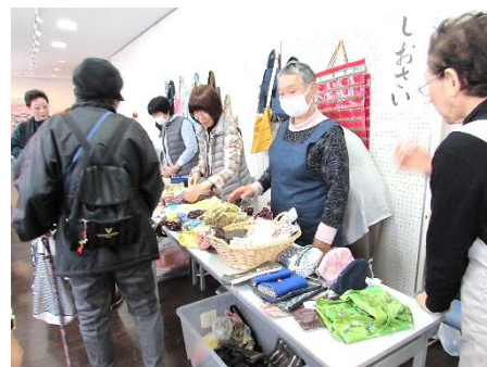
▲春日の布製品販売コーナー