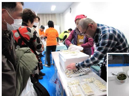
▲黒潮会の水餃子(たれは、パクチー、にんにく豆板醤、豆板醤)▲