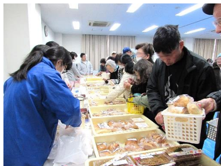
▲販売に奮闘中のメンバーと職員▲