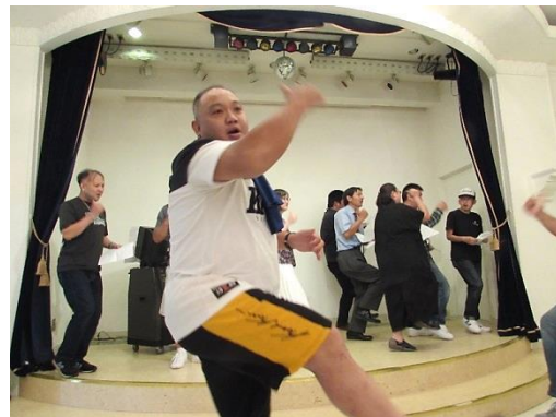
▲三崎のメンバーによる歌とダンス