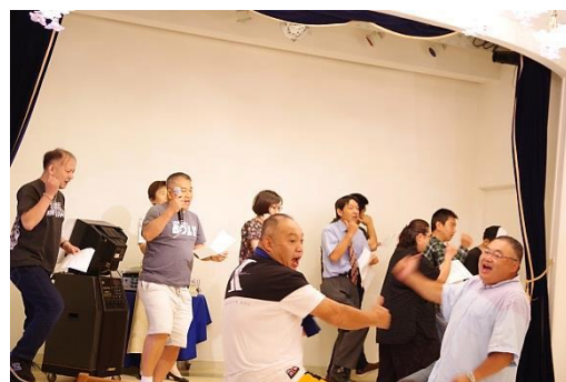
▲春日メンバーのKさんも参加!