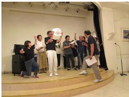
▲オリンピック 東京開催決定!