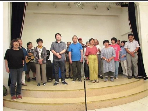
▲春日のメンバーと職員の合唱

予定では、カラオケ大会の後、恒例の銚子大漁節を全員で踊ることになっていましたが、時間が押してしまったので、今回はナシでお開きとなりました。