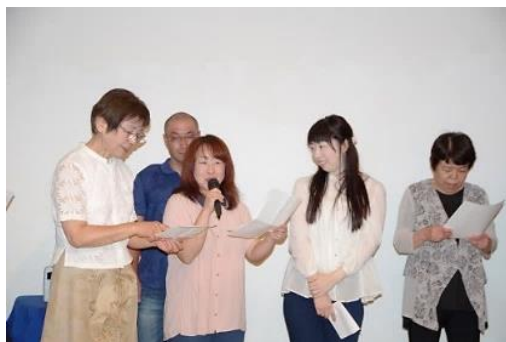
▲私、オリンピック4連覇です(伊調 馨)