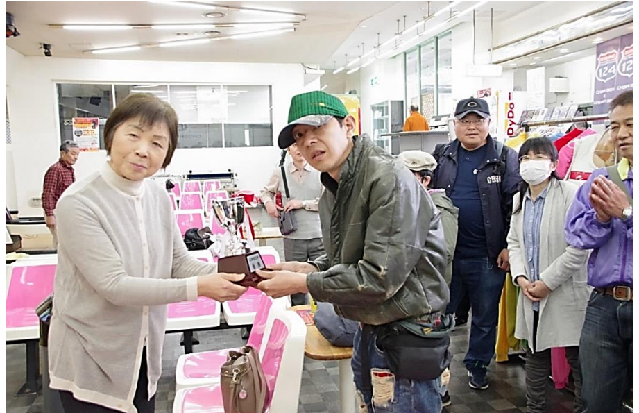
▲館さんへ優勝杯授与