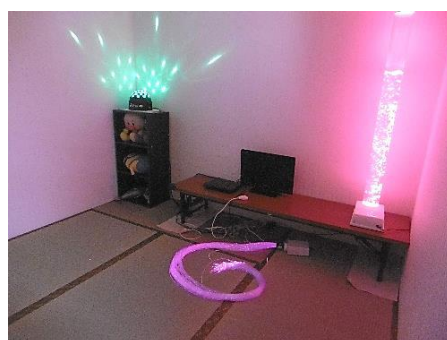
▲畳の小部屋（2階・電飾点灯）