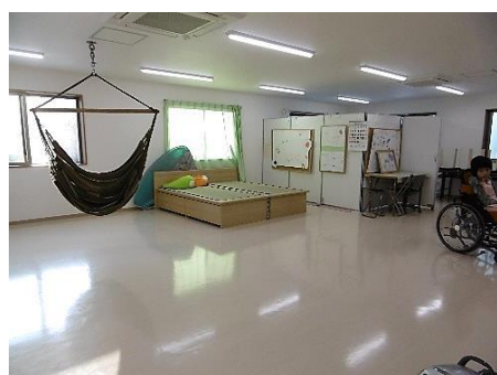
▲「にっこりえがお」（1階）