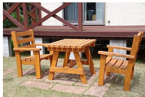
▲設置したテーブルとイス

就労移行では、製作が可能な範囲での注文をお受けしておりますので、お気軽にご相談下さい。