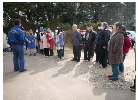
▲ 講評と防災についてのお話