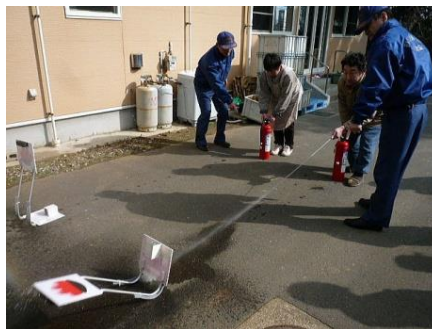
▲ 消火器の使用実践