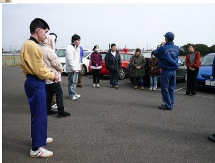
▲ 消火器の使い方の説明