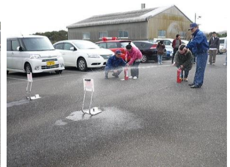
▲ 消火器の使用実践 2