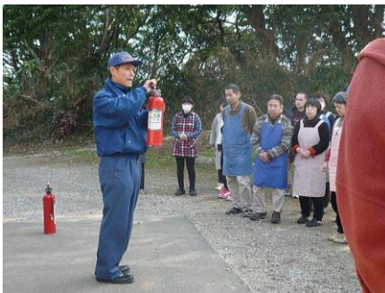
▲ 消火器の使い方の説明