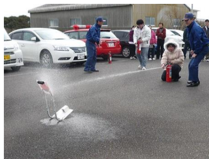
▲ 消火器の使用実践 1