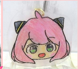
可能性が無限大の「プラ板」 今回はキャラクターでストラップ作りでした。