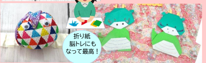
折り紙 脳トレにも なって最高！