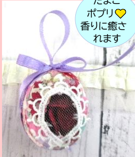
たまご ポプリ♡ 香りに癒さ れます