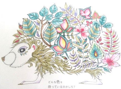
どんな色を 持っているのかしら？