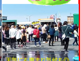
天気にも恵まれ気候も◎