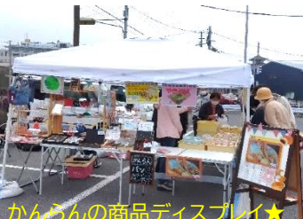
かんらんの商品ディスプレイ★