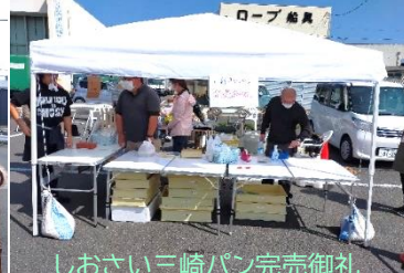
しおさい三崎パン完売御礼