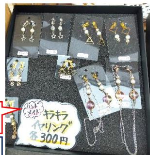
キラキライヤリング を300円